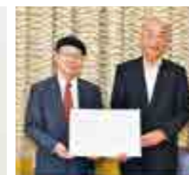
福知山公立大学との連携・協力に関する協定締結式